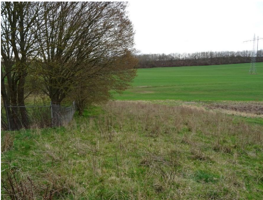
Foto Nr. 10 Blick nach Süden vom Wirtschaftsweg über das Plangebiet außerhalb der Umzäunung