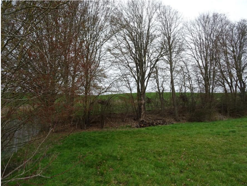
Foto 7 Blick nach Norden auf die Baumhecke