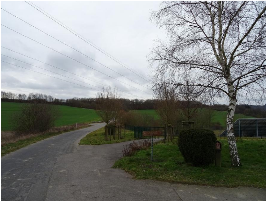
Foto 1 Blick nach Süden / Zufahrtbereich Abwasserpumpwerk