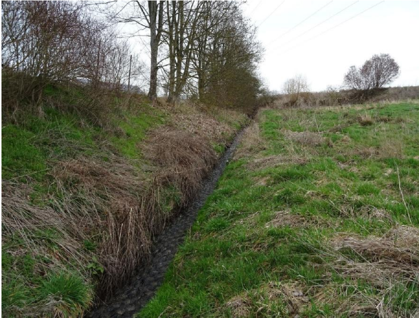
Foto 9 Blick nach Osten über den befestigten Klosterbach