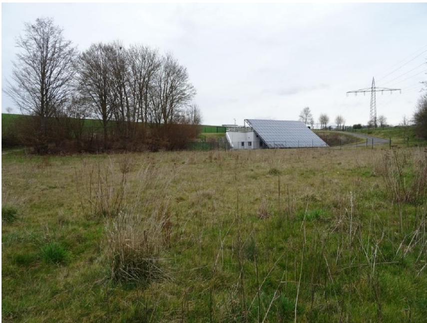
Foto 8 Blick nach Norden über das Plangebiet und auf das Abwasserpumpwerk