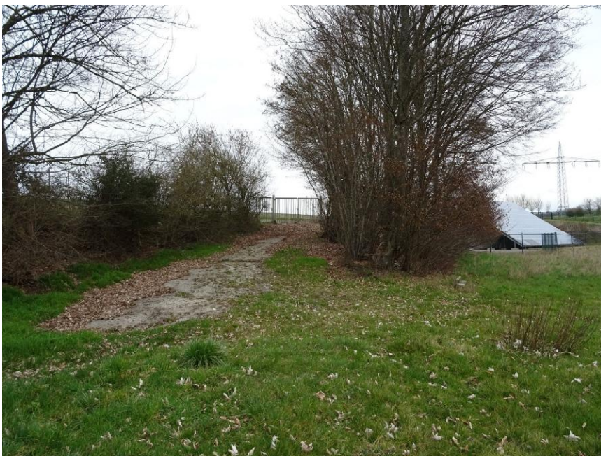
Foto 6 Blick nach Norden über den Zufahrtsbereich zum Plangebiet