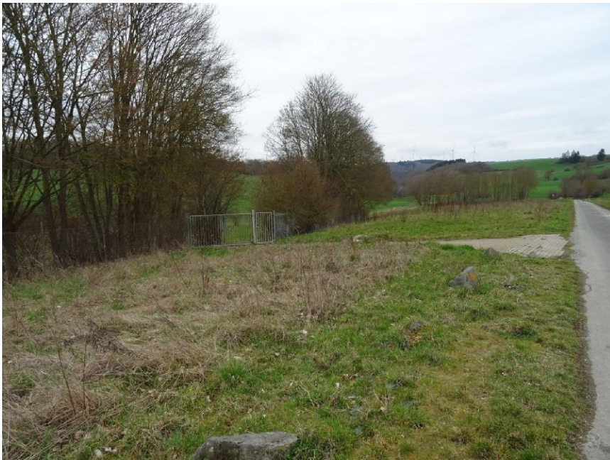
Foto 2 Blick nach Westen / Zufahrtbereich Plangebiet