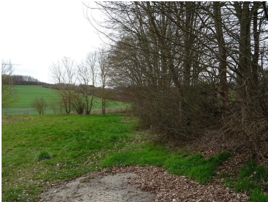
Foto 3 Blick nach Südwesten vom Zufahrtbereich Plangebiet