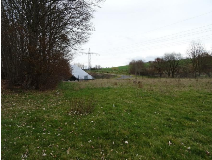
Foto 5 Blick nach Osten über das Plangebiet