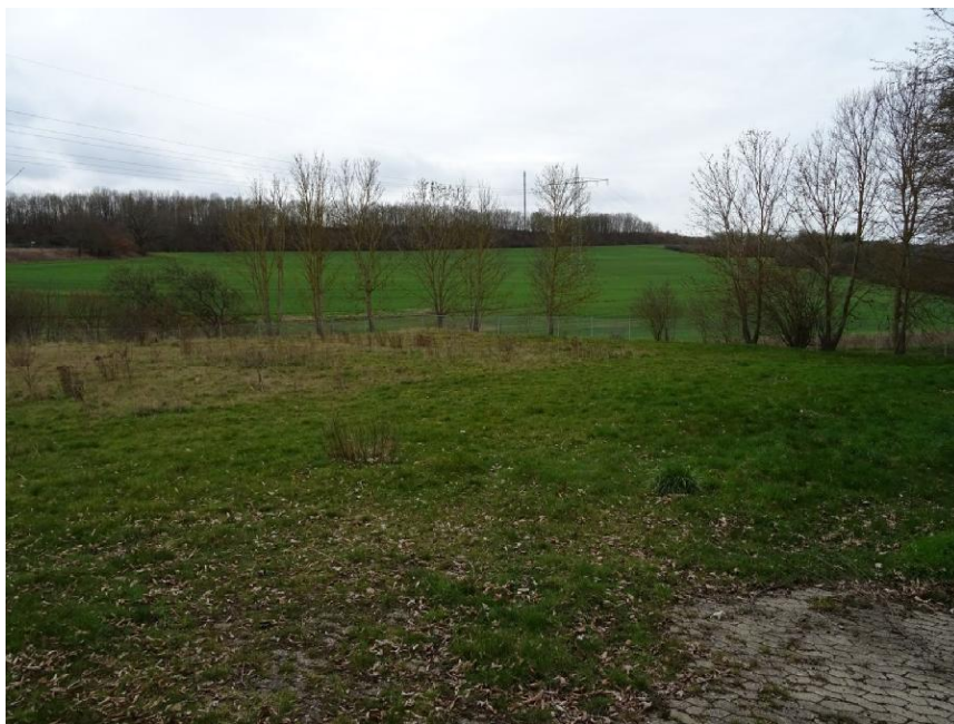
Foto 4 Blick nach Süden über das Plangebiet