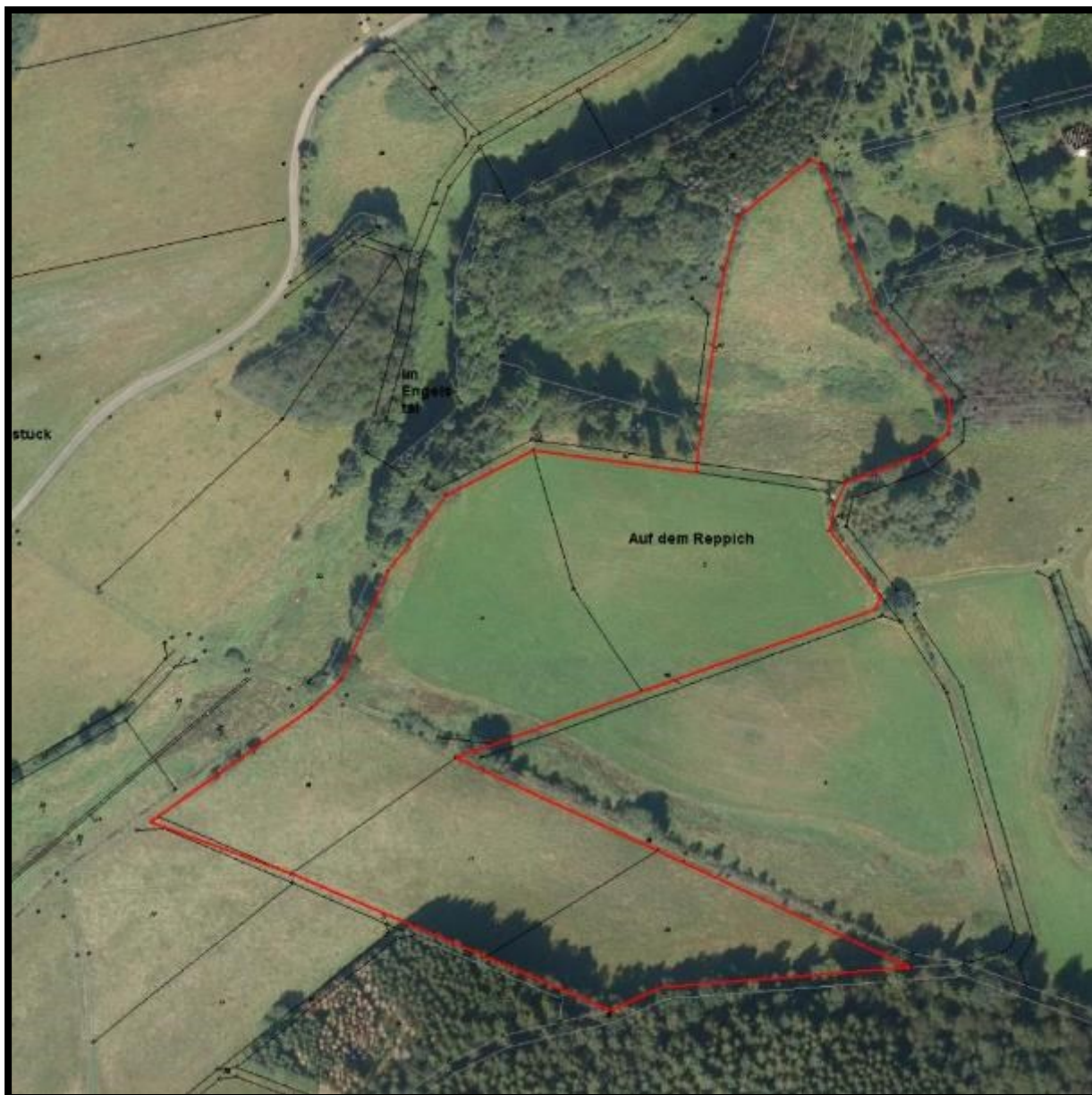
Abb. 2: Lage des Plangebietes Baar 1.