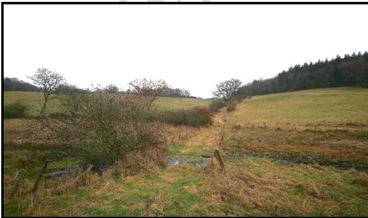
Bild oben: Extensivwiesen und Feldgehölze im Plangebiet Bild unten: Extensivwiesen und Feldgehölze im Plangebiet