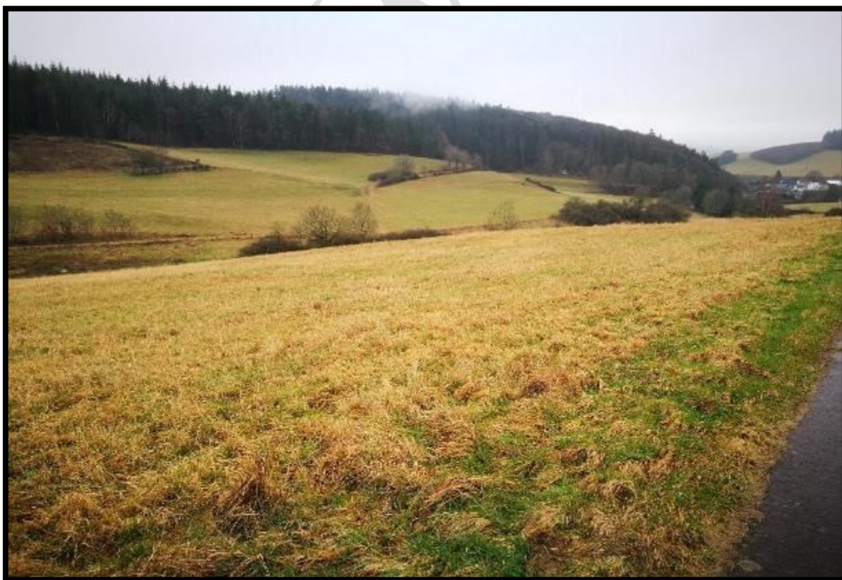
Bild oben: Quellige Feuchtwiese am Rande des Plangebietes Bild unten: Extensivwiesen und Feldgehölze im Plangebiet