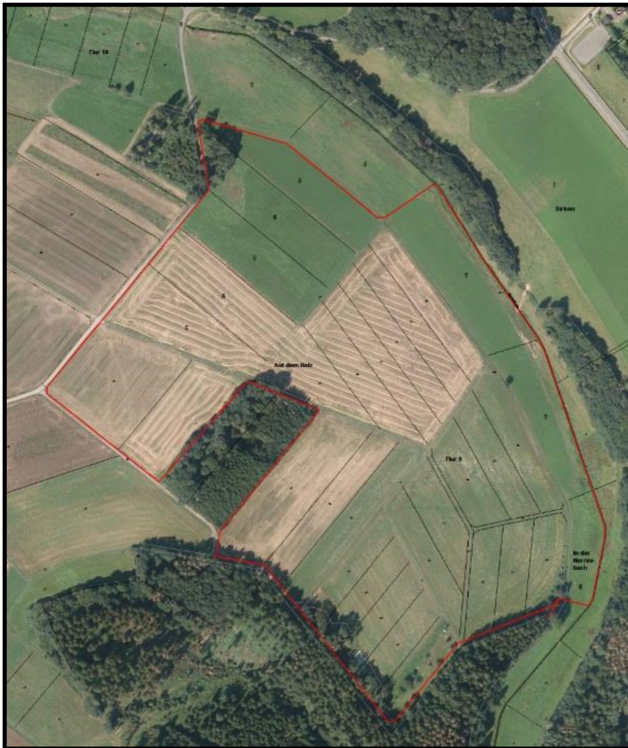
Abb. 3: Lage des Plangebietes Baar 2.