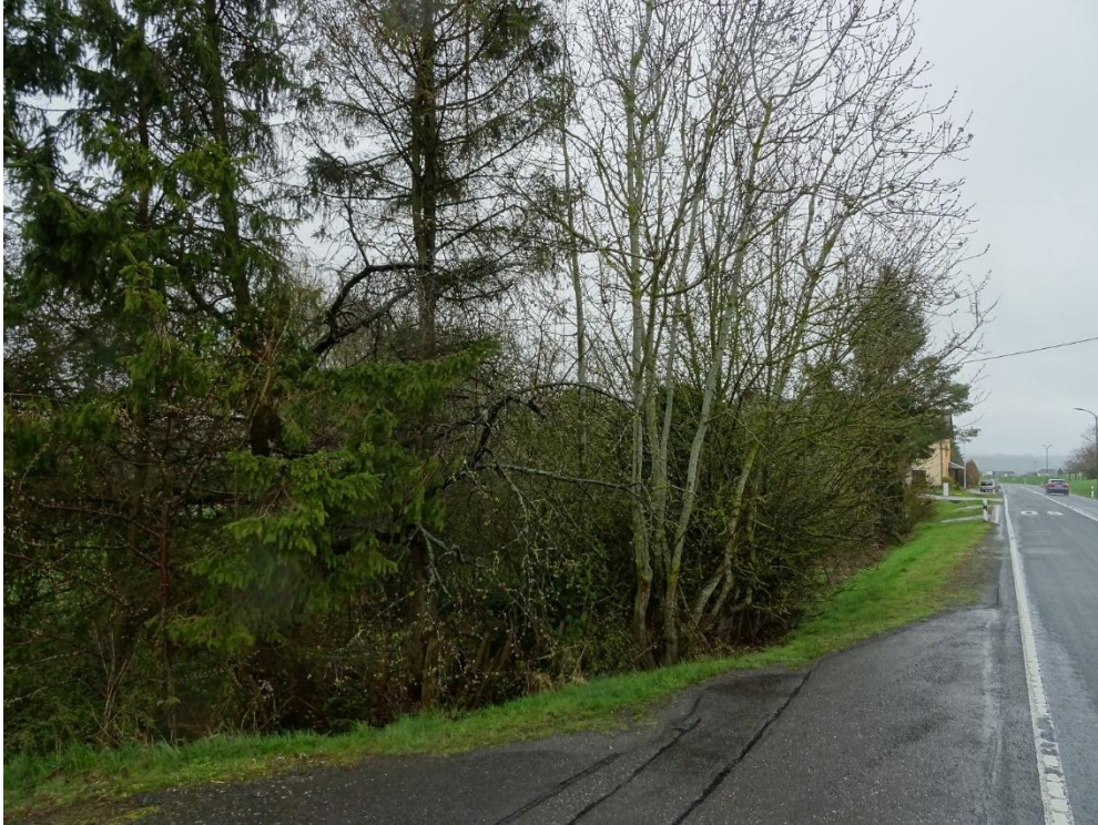
Foto 4 Blick nach Westen entlang der Hauptstraße