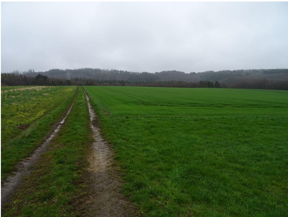
Foto 5 Blick nach Norden über das Plangebiet