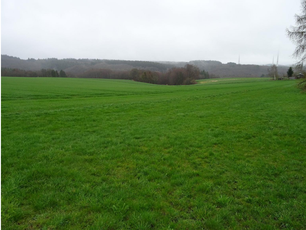
Foto 6 Blick nach Osten vom Plangebiet