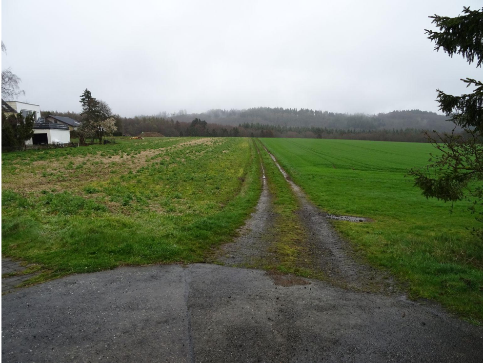
Foto 2 Blick nach Norden entlang des westlichen Plangebietsrandes