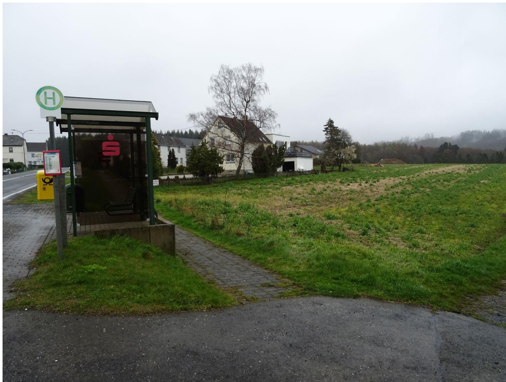
Foto 1 Blick nach Osten auf die dem Plangebiet anliegende Bushaltestelle