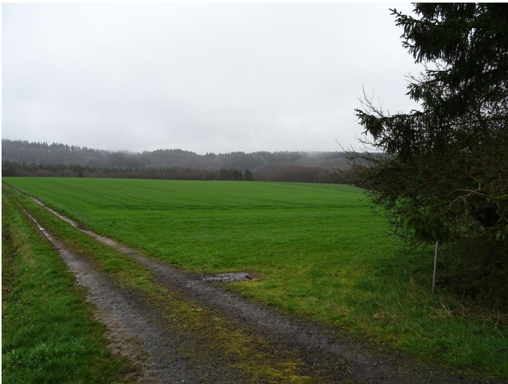
Foto 3 Blick nach Nordwesten über das Plangebiet