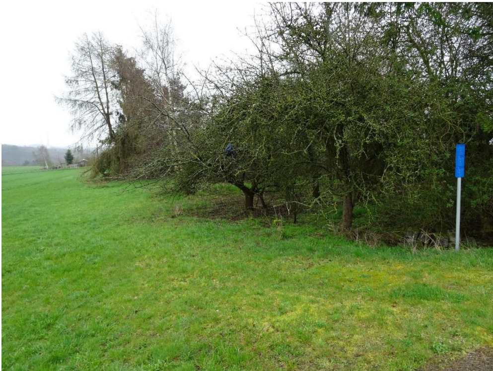
Foto 7 Blick nach Osten, Bereich Fettwiese / Gartenbrache